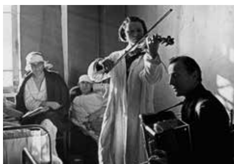
артисты смело ехали на очередную точку поднимать моральный дух солдат.

История агитбригад Центрального Дома Российской Армии насчитывает уже почти сто лет. Артисты военных учреждений культуры, которых он объединяет, служат своему зрителю, где бы тот не находился — в уютном зрительном зале или в спартанских условиях прифронтовой зоны. И как в самом начале пути, так и сейчас, с задачей по укреплению морального духа бойцов, защищающих наше Отечество, коллектив ЦДРА справляется на отлично.